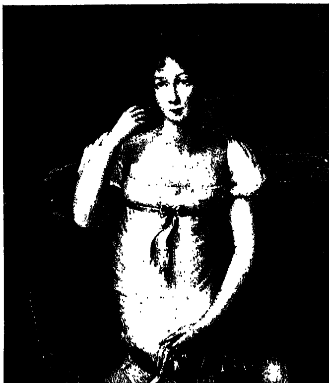
زوجة المارشال برتران.

في ٧ آب ترك نابليون مرافقاً بسبع وعشرين شخصاً الباخرة بيلروفون ليستقل الباخرة نورثمبرلاند التي ستقلهم إلى سانت هيلين. وقبل أن يفتح مارشان السرير العسكري للامبراطور في المقصورة كتب إلى أهله ليعلمهم بالمقصد الجديد.